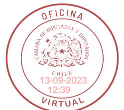
FIRMAO DIGITALMENTE: H.D. LORENA PIZARRO S.